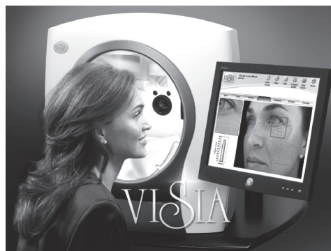
皮膚画像解析カウンセリングシステム VISIA-Evolution (Canfield社製)

P&G社開発ソフトを基に、豊富なデータ取りに裏打ちされた同年代の平均値とのデータの比較ができます。